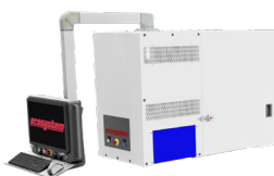
Barra di stampa: